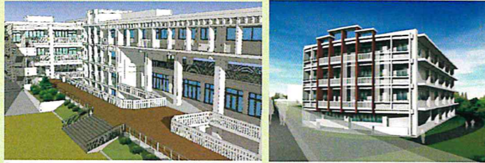
① 南西側外観イメージ(1工区) ② 南側(正面)外観イメージ(2工区)

会社も6JV・14社が集まった作業となることからチームワークを大切に安全第一で工事監理を進めていきます。