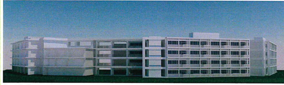
③ 東側外観イメージ(2, 3工区)